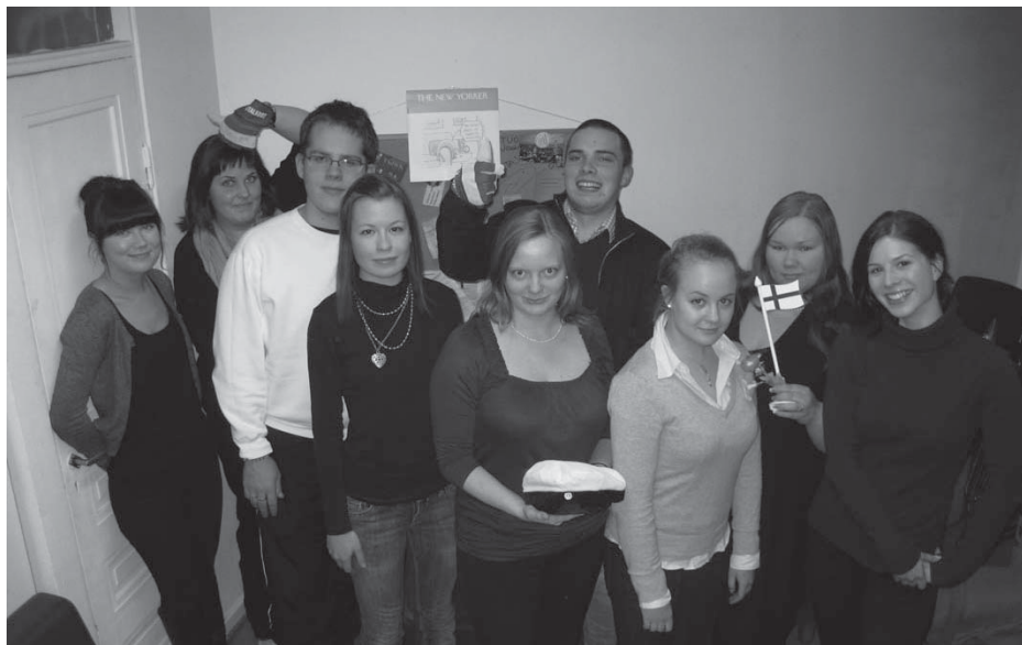
Kansalliset Ylioppilaat ry:n vuoden 2010 hallitus (Jani puuttuu kuvasta)

Ahdistun hisseissä, joten joudun aina kipeämään rappuset KansYn toimistoon, 7. kerrokseen. Siinä kuntoni salaisuus.